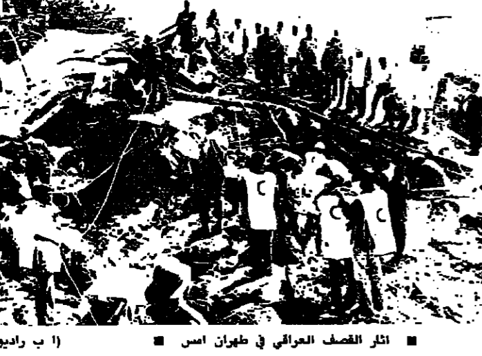
الصف الثاني في طهران (أ) (ب) رابو